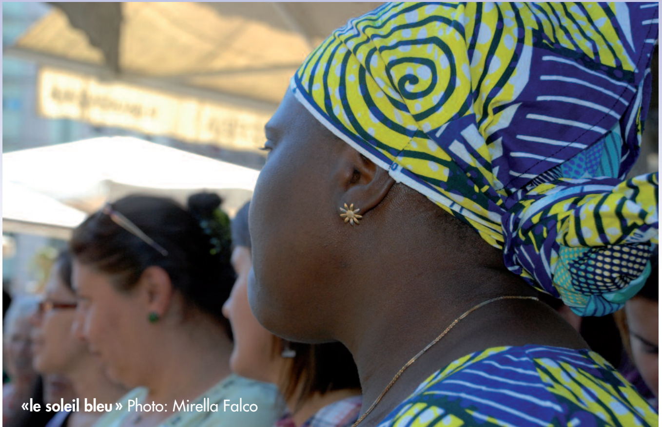
«le soleil bleu»