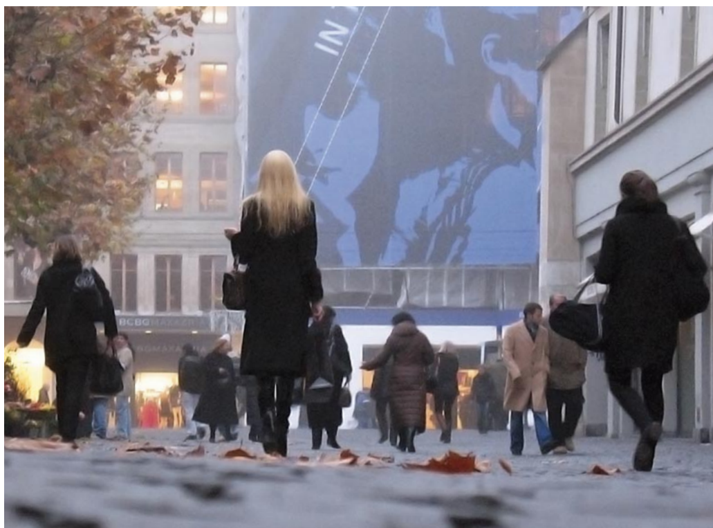
« Courses d'automne »