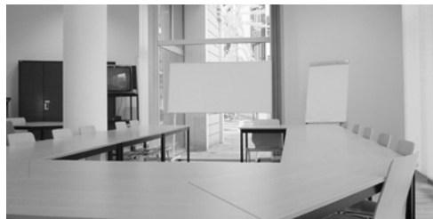
Salle de cours « Arcade » - capacité 20 places