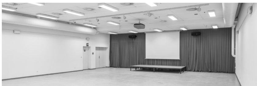
Auditorium Wyss - capacité 180 places. Possibilité de louer également une cuisine.

Le bâtiment dispose d'une connexion WiFi. Sur demande, un équipement complémentaire peut être mis à disposition : PC portable, beamer, microphones, rétroprojecteur et flipchart.