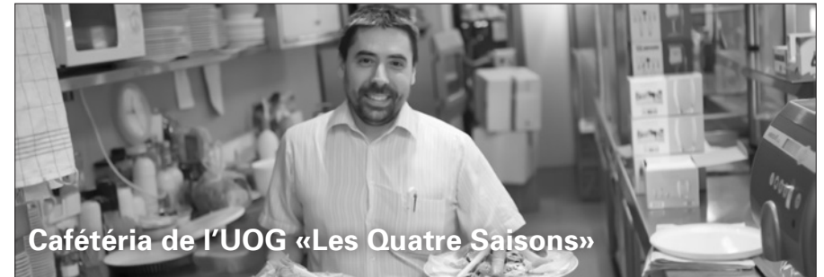
Cafétéria de l'UOG «Les Quatre Saisons»