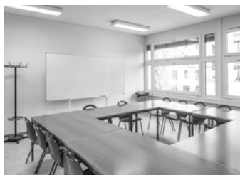
Des salles de cours - capacité 16 places